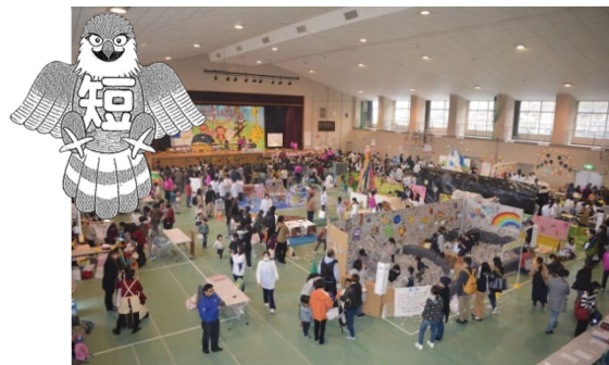
第8回 Iwatan 親子フェスタ(1600 名来場)

地域に愛され信頼される短期大学の構築のため、教職員も学生も地域社会の一員として、建学の精神「楽学」、教育理念「地域に生きて働く人材の養成」の実現に邁進して参ります。