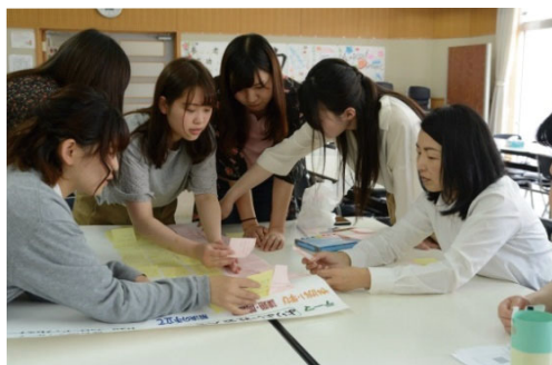
卒業生対象フォローアップセミナー