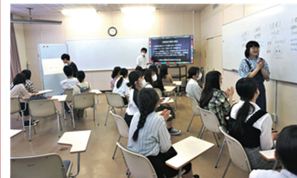
ICT化の進んだAL (アクティブ ラーニング) 演習室 (岩国短期大学)

令和元年度は、岩国短期大学にICT教育設備整備を行い、日々の授業で活用しています。また、目途指定のご寄付によって短大・高校事務室にパソコン、プリンターを整備致しました。