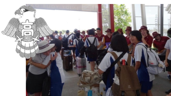
オーストラリア 姉妹校 (サザンクロス校) 訪問

A I化やグローバル化、少子高齢化が急進する21世紀においても、「徳性の陶冶」によって子どもたちのたくましく生き抜く力を培い、社会に送り出すことを使命に、教職員一丸となって取り組んで参ります。